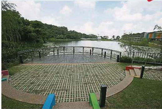
图书馆外设有一个小型剧场,是与停车场工程一同新增的设施。

《大都会》社区报记者早前走访该图书馆,发现图书馆毗邻的多层停车场已经启用,每日每次进入收费为2令吉,备有高尔夫球车(buggy)载送往来于停车场及图书馆之间。