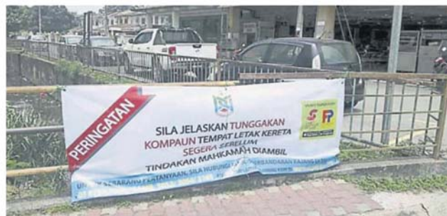
锡米山大路挂上横幅, 提醒拖欠泊车费的车主赶快缴清罚款, 以免被控上庭。