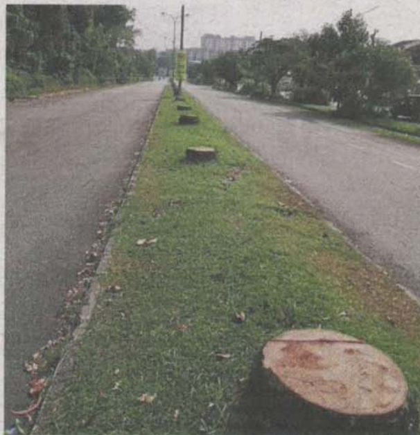
What remains of the palm trees along Jalan Asa 1 in Kajang that were chopped down.

"Maybe there were few trees that were not healthy, but defi-