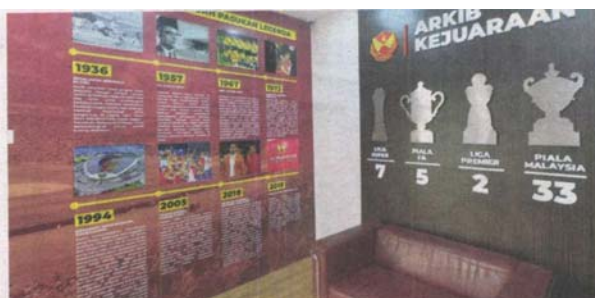
PAPAN arkib yang memaparkan sejarah dan kejuaraan yang berjaya diperolehi oleh pasukan Selangor.