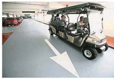
雪州图书馆备有接送民众川行于图书馆及停车场的服务。