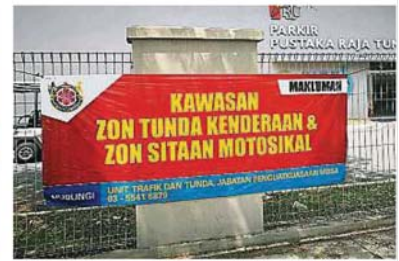
沙亚南市政厅在停车场外张挂横幅,通知民众该区是禁区,勿将车辆停放路边。