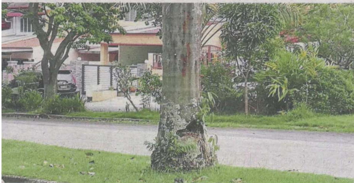
MPKj says the palm trees were rotting and had holes at their base, just like this one.

"Leaving the stumps as it is, is a disgrace and an ugly sight," he added. — By VIJENTHI NAIR