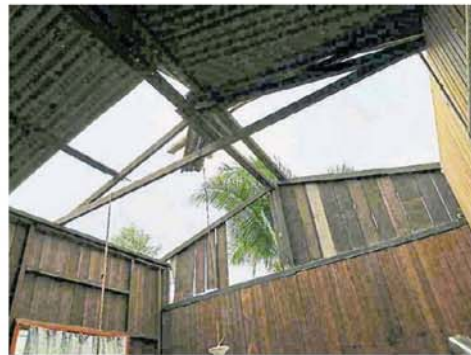
■适耕庄的马来甘榜，有16间房屋的屋顶在上周日被狂风吹走，幸未造成人命伤亡。

雪州议长兼适耕庄州议员黄瑞林则表示，因气候剧烈变化，风灾频发发生，各政府部门将尽量协助灾民重建家园，希望居民在狂风暴雨时注意自身安全，也要定期检查住家的结构是否稳固，以尽量降低风灾风险。