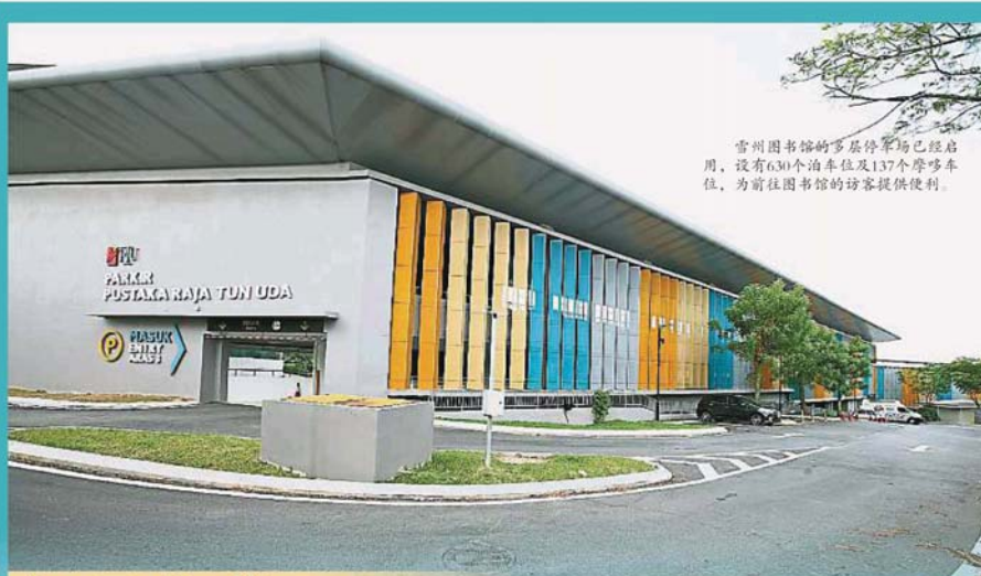
雪州图书馆的多层停车场已经启用，设有630个泊车位及137个摩多车位，为前往图书馆的访客提供便利。

Provided for client's internal research purposes only. May not be further copied, distributed, sold or published in any form without the prior consent of the copyright owner.