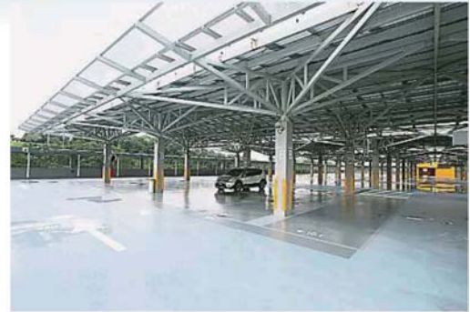
停车场顶楼设有太阳能电板,并可作为遮阳屋顶,一举两得。