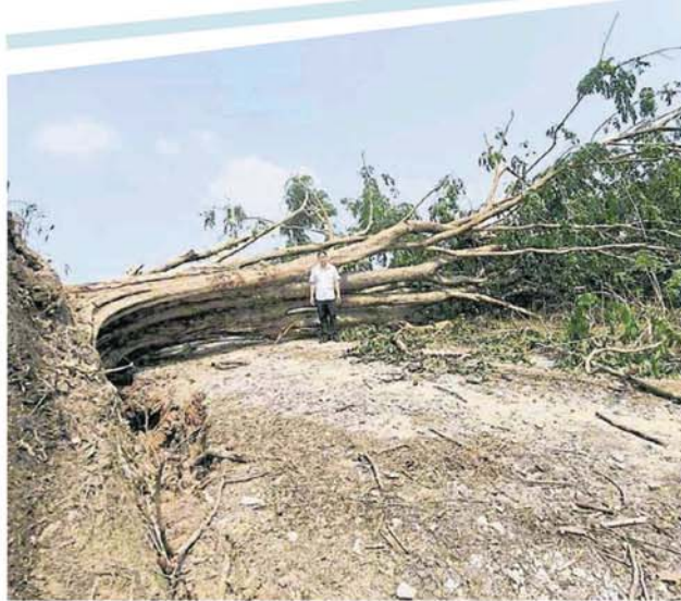
■近百年历史的大树被狂风连根拔起，触目惊心。