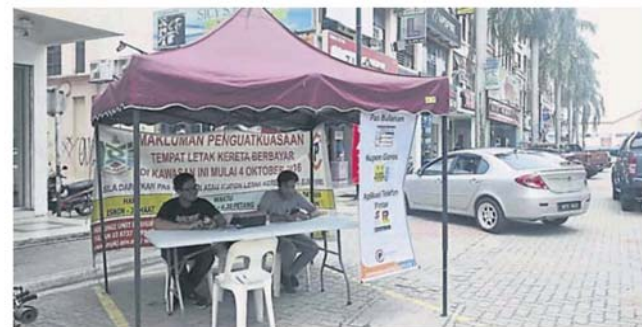
承包公司在加影美景坊开设服务柜台。

另外, 泊车承包公司也会到各个商业区开设服务柜台, 让车主询问、购买固本和缴交罚款, 并鼓励车主使用手机应用程序缴交泊车费。