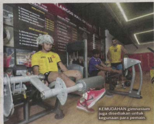
KEMUDAHAN gimnasium juga disediakan untuk kegunaan para pemain.