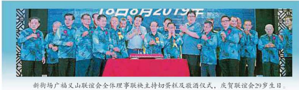
新街场广福义山联谊会全体理事联袂主持切蛋糕及敬酒仪式，庆贺联谊会29岁生日。