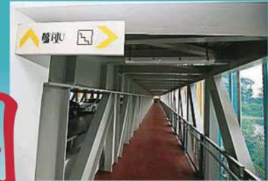
两座停车场之间有一个街接桥，让民众可步行到图书馆。