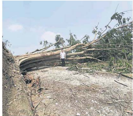
近百年历史的大树被狂风连根拔起，叫人触目惊心。