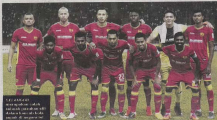
SELANGOR merupakan salah sebuah pasukan elit dalam kanak-kanak bola sepak di negara ini.

"Kami pernah menggunakan Padang SUK untuk melakukan latihan sebelum