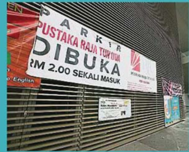
雪州图书馆挂横幅，通知民众停车场已经启用及费用为2令吉。