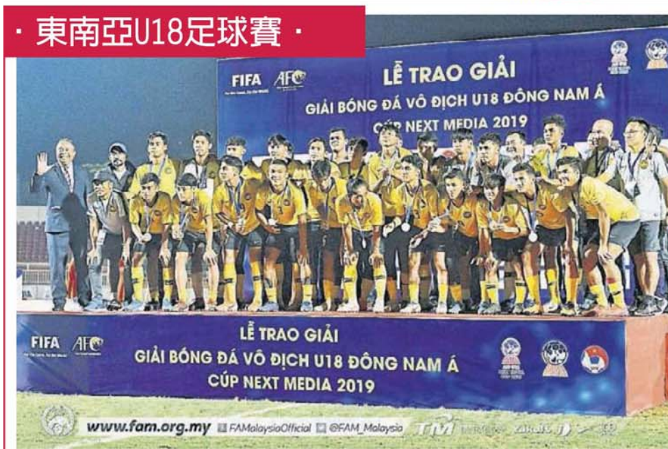
■ “小虎队”在决赛不敌澳洲，只能满足于亚军成绩。