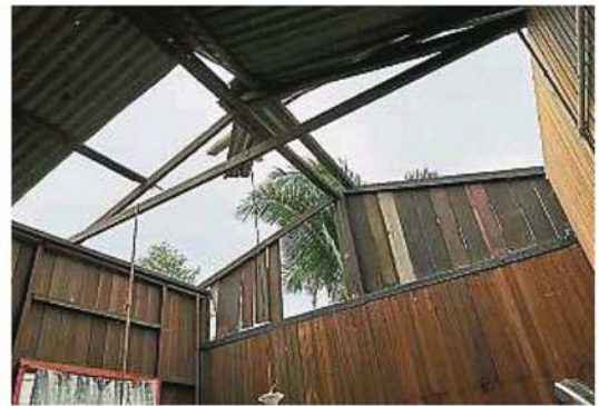
▲適耕莊的馬來甘榜，有16間房屋的屋頂在上周日被狂風吹走，幸未造成人命傷亡。