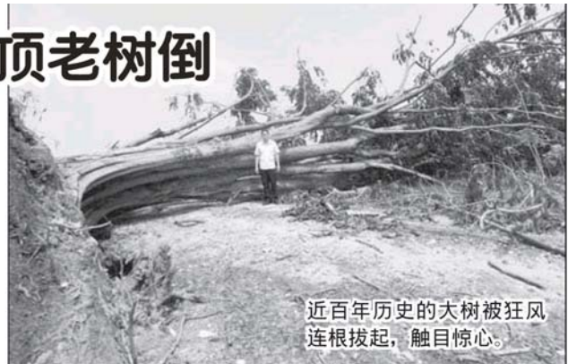
近百年历史的大树被狂风连根拔起，触目惊心。

数政府部门包括大港国会议员与适耕庄州议员服务中心、沙白县福利局、土地局与伊斯兰教献捐局，日前也派员探望灾民，除了移交援助品，也记录风灾破坏程度，择定未来数日颁发援助